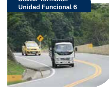
Sector Termales Unidad Funcional 6