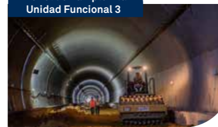
Túnel de Pamplonita Unidad Funcional 3