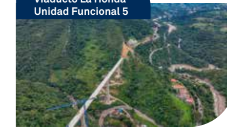
Viaducto La Honda Unidad Funcional 5