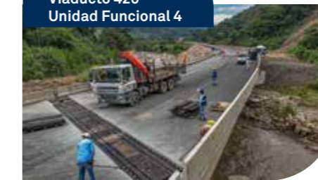
Viaducto 420 Unidad Funcional 4