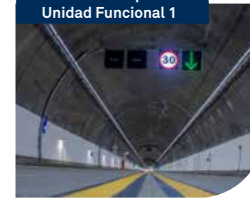
Túnel de Pamplona Unidad Funcional 1