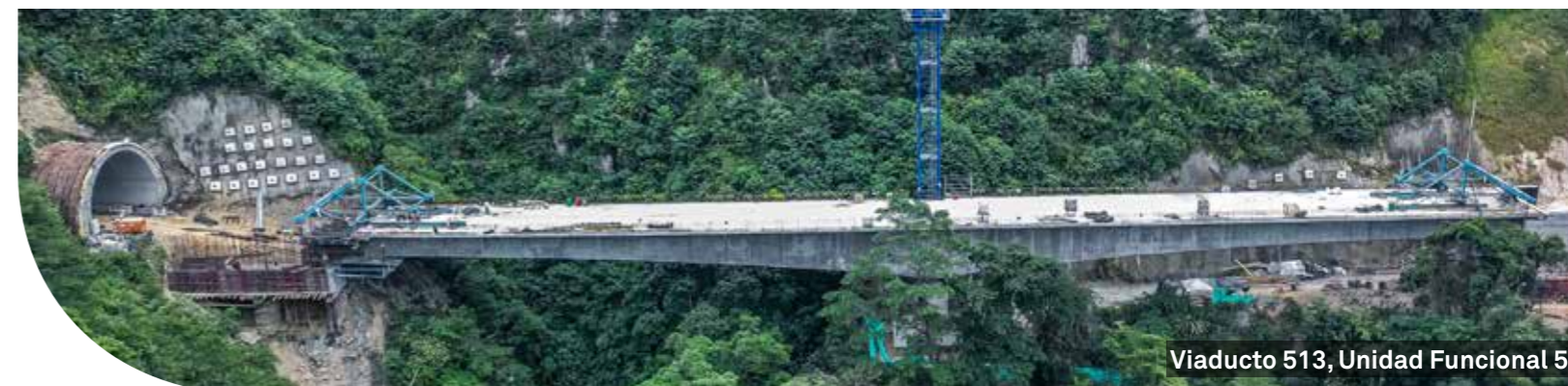
Viaducto 513, Unidad Funcional 5